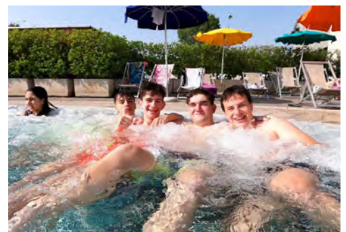
Nelle foto, le squadre del Mini torneo di calcio dei ragazzi del gruppo ADO, e alcuni momenti della giornata passata ad Acquaword con i capigruppo e animatori del Cre 2021.